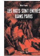
IMAGE Le rat n'a jamais eu bonne presse en France. Animal impur dans la Bible, au XIX e siècle il devient en outre

associé à la maladie. Et pourtant, la population citadine semble redécouvrir le rongeur à