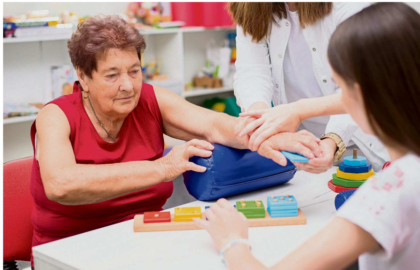
Selon la zone affectée par la lésion, le cerveau est incapable d'accomplir certaines tâches. Il faut donc le rééduquer, même pour les actions les plus simples.

Dix à douze semaines de traitement, à raison d'une ou deux séances hebdoma-