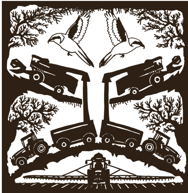
Planche accompagnant la fiche sur la pie-grièche grise | Marcel Barelli/EPFL Press

De la linotte à la pie, la liste serait trop longue à faire ici des espèces menacées ou ayant déjà disparu du fait des pesticides, soit par empoisonnement direct soit via la disparition de leurs proies.