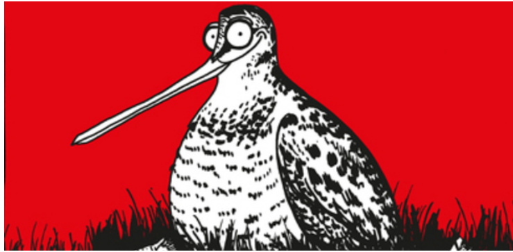
Couverture du Bestiaire helvétique | Marcel Barelli/EPFL Press

Comment présenter l'ensemble des vertébrés qui vivent en Suisse sans tomber dans un long inventaire à la Prévert? C'est le défi que s'est lancé l'illustrateur Marcel Barelli avec son « Bestiaire helvétique », édité par EPFL Press, dans un style graphique qui détonne avec les habituels guides animaliers.