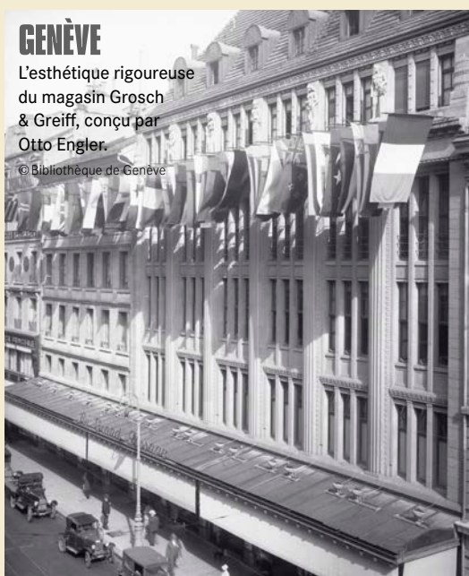
GENÈVE L'esthétique rigoureuse du magasin Grosch & Greiff, conçu par Otto Engler.

Parmi les bâtiments « allemands » construits en Suisse au XIX e et au début du XX e siècle figurent la première gare de Bade à Bâle, le château historiciste de Hünegg, au bord du lac de Thoun, plusieurs églises et de nombreux grands magasins. Ce qui caractérise ces derniers ? Une architecture « verticaliste », des façades rythmées de travées régulières, des meneaux de pierre cachant une structure de béton armé et la mise en évi-